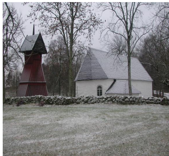
Ornunga gamla kyrka 2009.