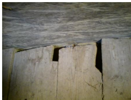
Bild nr. 4 Golvet i kyrkorummet med det huggna "ligget", ett spår efter enbladig ramsåg foto J Mårtensson 2009.