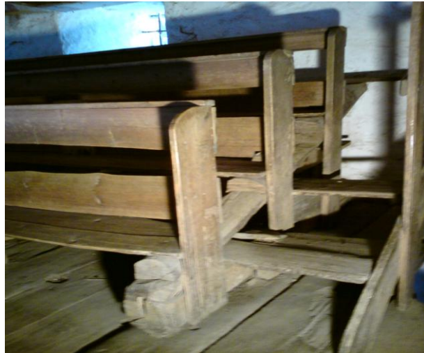
Bänkarna på den västra läktaren foto J Mårtensson 2009.

Den undre bjälken är fastspikad i golvklovarna och den övre trapplik huggen dels som upplag för själva sittbrädan och dels för att man lättare skall kunna kliva in i bänkraden. De väl slitna sittbräderna och ryggstöden består av 1 ¼ tums granbräder med kärnsidan upp. Undersidan visar spår efter enbladig ramsåg. Sittbräderna och ryggstöden har längdmässigt inte räckt till utan man har varit tvungen att skarva bräderna, detta är gjort med en utdragen diagonal fasning utan att bräderna hamnat i samma liv. Lösningen är funktionell men inte för ändamålet, dessa av rumpor välnötta skarvar kan inte ha varit sköna att sitta på (se bild nr 1 i bilagan). Snickeriarbetet är påfallande enkelt i sitt utförande och nivån på det färdiga resultatet är inte begränsat av material eller verktyg utan det blev nog som tänkt. Man har genomgående haft mycket god virkeskvalitet.