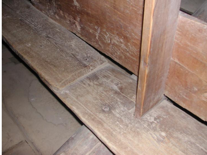
Bild nr. 1 Fasad skarv av bänkbräder