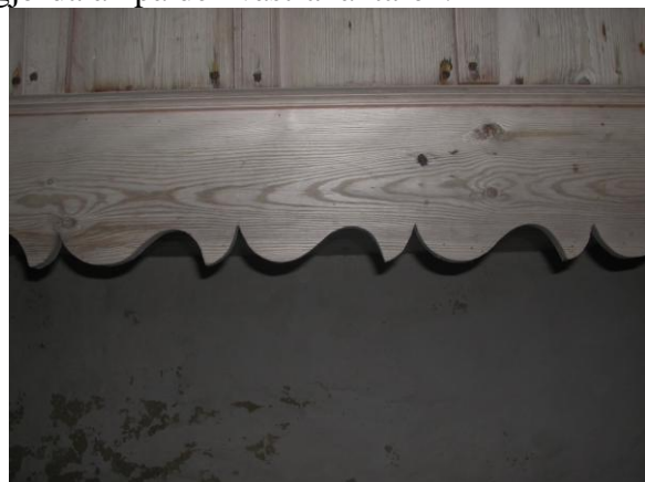
Snickarglädje på den västra respektive norra läktaren foto J Mårtensson 2009.

Man kan konstatera att ju längre bak i kyrkorummet ett bearbetat föremål är, desto sämre utfört är det, är de dessutom inte synliga nere i från exempelvis predikstolen som läktarens bänkar, är de rent av slarvigt utförda. Den norra läktaren har tre bänkrader, här har man löst bänkarnas trappning och stomkonstruktion på ett annat vis, den utgörs av tre stycken tre tums