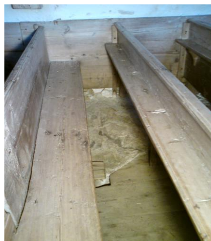
Bild nr. 5 Berg kommer upp i dagern ur kyrkorummets trägolv.