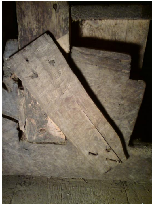
Bild nr. 2 Lagning av kyrkbänk