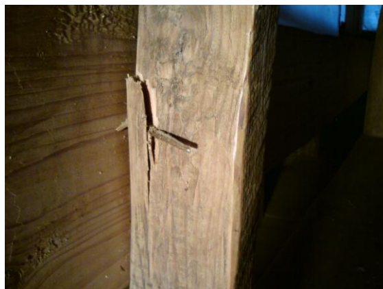
Den smidda spiken som stack mig i ryggen foto J Mårtensson 2009.

I en tid som denna då man bland brädgårdens finhyvlade regler omöjligt kan få en sticka i fingret kan ett besök i Ornunga gamla kyrka kännas som en månfärd. En svunnen tid och ett svunnet leverne tränger sig påtagligt på besökaren, här möts man av grovt tillyxat snickeri, böjda spik och flisiga ytor. Här råder de enkla och de praktiska lösningarna, funktionalitet har gått före utseende. Dagens byggande och byggare är så långt ifrån detta tänkande eller tillstånd att vi nu mer till och med har svårt att utföra trovärdiga restaureringar och rekonstruktioner. Det skulle dock kännas löjeväckande att med flit spika upp skevt avsågade bräder, man kan bara lugnt konstatera att miljöer likt Ornunga gamla kyrka är av ett mycket stort kulturhistoriskt värde. Här har vi dels unika kyrkomålningar, medeltida takstolar och träskulpturer, men vi har även en möjlighet att studera och förstå de människorna som lämnat dessa byggnader efter sig. De var troligen så olika oss som de spår de lämnat och den där spiken som stack mig i ryggen känns som en viktig kugge till förståelse och av högsta kulturhistoriska värde, var det kanske det timmermannen tänkte, när han avstod ifrån att dra ut den.