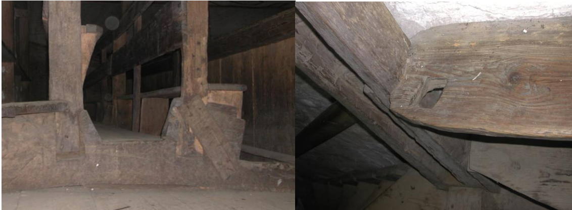
Stommen till den norra läktarens bänkar med lagning i form av brädlapp och krökta spik (se även bild nr 2 i bilagan) samt sittbräda med hankhål foto J Mårtensson 2009.

ekplank, trapplikt uthuggna, här har man gradat in stolpar som bär sittbräderna och ryggstöden. En av gradningarna har troligtvis haft dålig passform och glappat. Detta har man löst genom att till stolpen spika på en sträva i form av ett gammalt tak spån, några av spikarna har krökts. Reparationen är fullt funktionell men hade passat bättre i en lada. I ändan av en sittbräda finner man ett hankhål som har huggits med en gluggyxa, dessa gjordes för att underlätta timmertransporter. I hankhålen fäste man ett rep eller en kedja så att man med häst kunde dra ut timret ur skogen, detta smycke tror jag inte är välkommet att klä dagens kyrkbänkar.